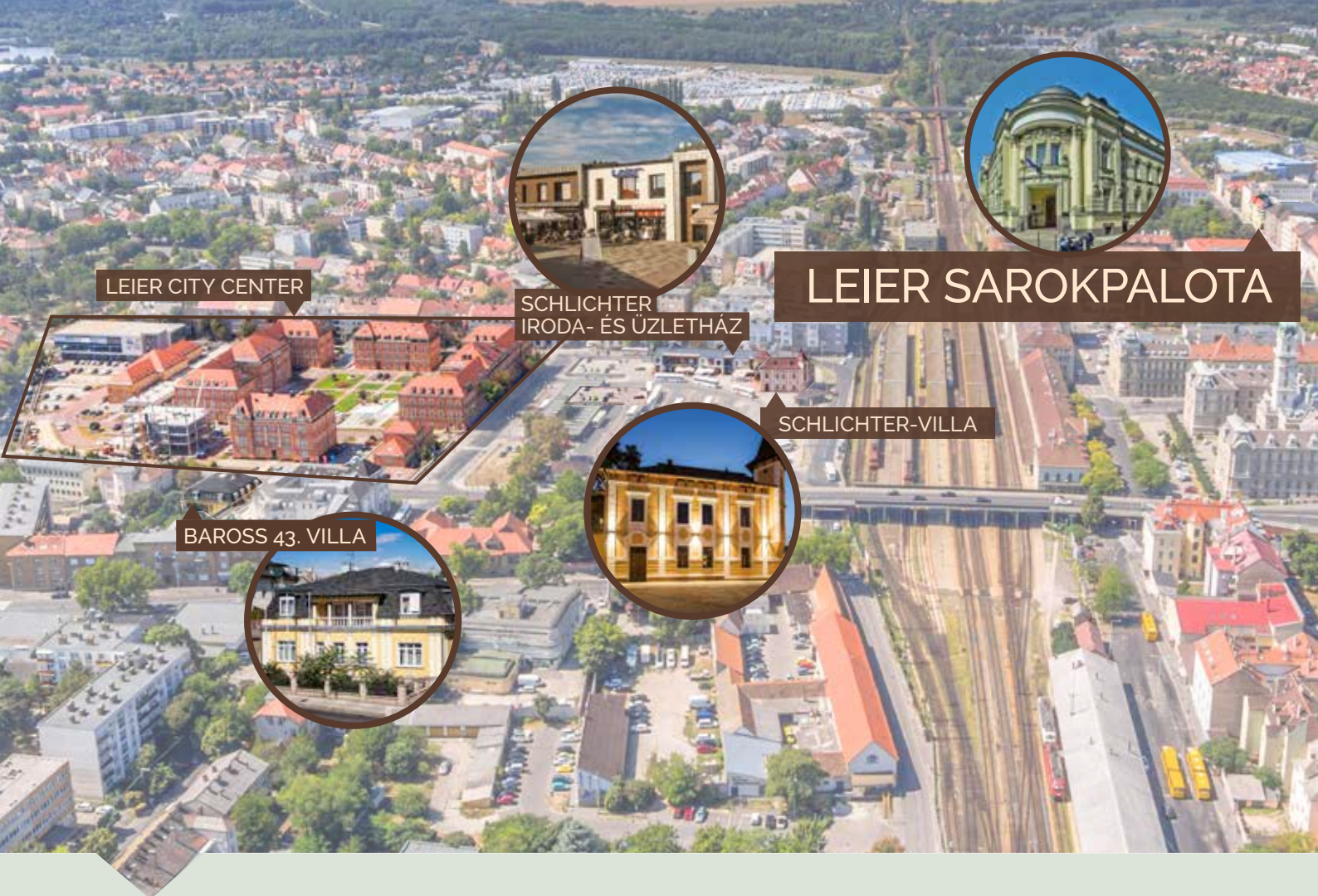
LEIER CITY CENTER