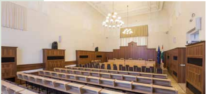
Felújítás előtti képek