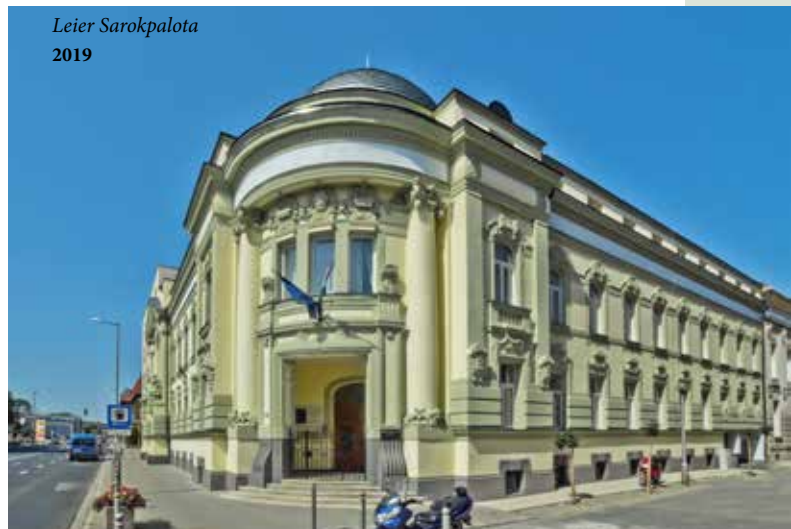
Leier Sarokpalota 2019

A győri kamarakerületi kereskedők és iparosok gyönyörű székháza 1904-ben épült. A kivitelezési munkák többségét a kerület iparosai végezték. A pompás, kupolás, szecessziós sarokpalota díszes lábazattal, a homlokzatán figyelemreméltó faragott, figurális díszítéssel és épületplasztikákkal, szobrokkal, kapriorai márványból készült belső körlépcsővel, kovácsoltvas korlátokkal, különleges, színes üvegablakokkal, stukkós mennyezettel és terazzo burkolattal rendelkezett, és a városkép meghatározó eleme volt. A II. világháborút követően, 1948-ban megszűntek a kereskedelmi- és iparkamarák, és az állami kezelésben álló székház a Műszaki és Természettudományi Egyesületek Szövetsége (MTESZ) tulajdonába került.